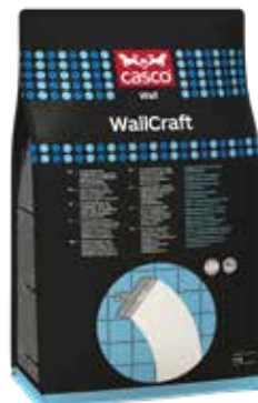
Pose 4 kg

Skrapsarkle, sparkle, slip og du har en slett flate klar for maling eller tapet i løpet av dagen.