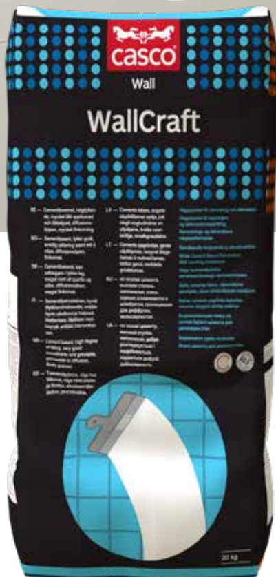
Sekk 20 kg

WallCraft-metoden: Ferdig vegg på rekordtid!